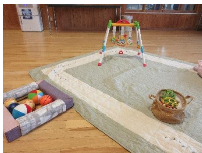
あかちゃんコーナー